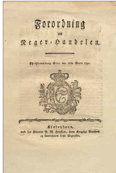
Figur 2. Forordningen om negerhandelen.

Med oplysningstiden skiftede menneskesynet, og slavetransporten over