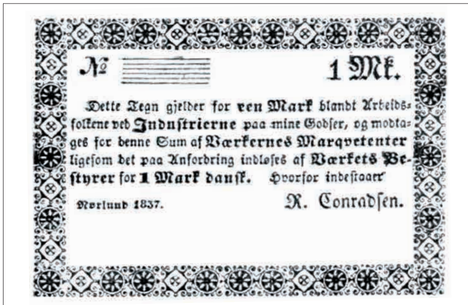
Figur 5. Rasmus Conradsens pengeseddel ( www.danskemoent.dk )