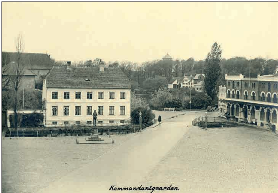
Figur 3. Kommandantgården. Ved siden af denne ca. mellem bilen og den hvide bæk lå Stokhuset.

Det havde været interessant at finde en egentlig slaverulle for Nyborg Fæstning, men det har ikke været muligt. Der findes imidlertid én hos Slægtshistorisk Forening for Viborg og Omegn. 5 Det er ikke så vigtigt, hvor slaverullen stammer fra, for slaverne blev ofte flyttet rundt mellem fæstninger med stokhuse, og de havde sjældent lokal tilknytning. Det vigtige er beskrivelsen af slavernes situation.